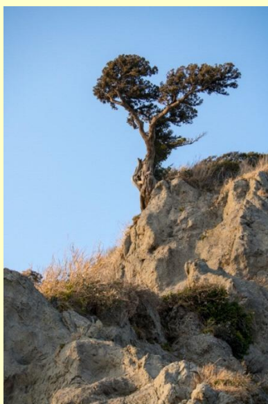
江の島のニケ

猛暑もようやく終わりました。季節が一巡するといよいよ東京オリンピックピック・パラリンピックを迎えることとなります。江の島大橋は三車線となり、ヨットハーバー内の設備も充実してまいりました。ところで江の島の岩場に、ルーブル美術館の至宝の一つ「サモト トラケのニケ」を彷彿とさせるビヤクシンの古木が一本、すくくと立っていることをご存知でしょうか。「ニケ」はギリシア神話の勝利の女神。いろいろなニケ像がありますが、夏のオリンピックの勝利の女神をデザインとして取り入れるこ