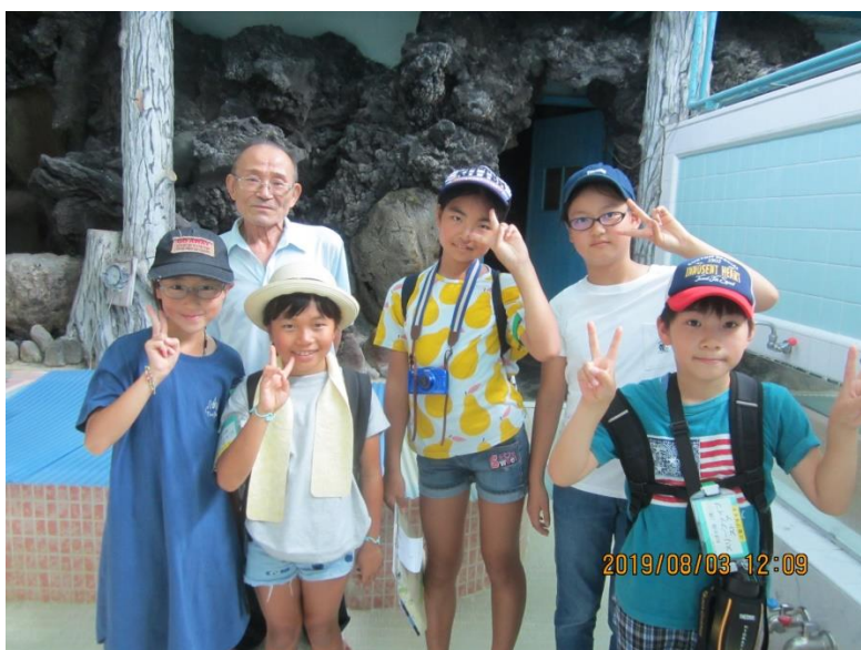
辻堂唯一のお風呂屋 不動湯さん