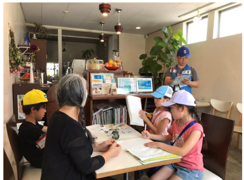
喫茶「風音」（かのん）さん