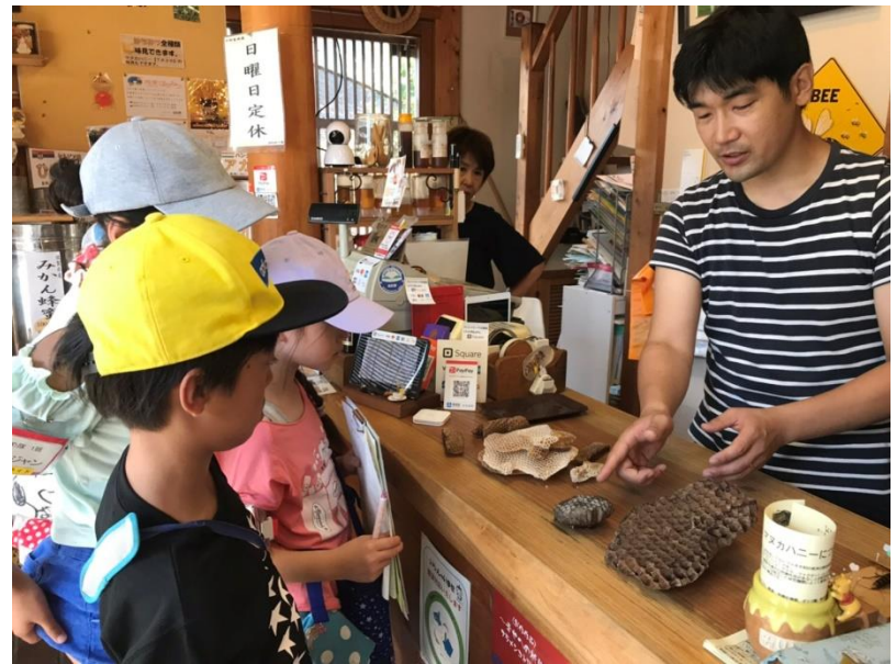
中野養蜂園（はちみつ屋）さん