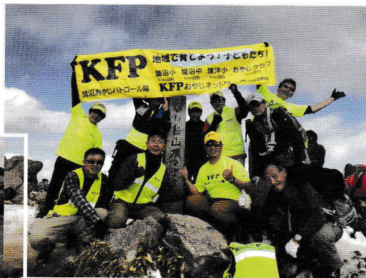
バーベQ スキー旅行 登山部 バンド