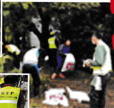
鵜沼中グリーンディ