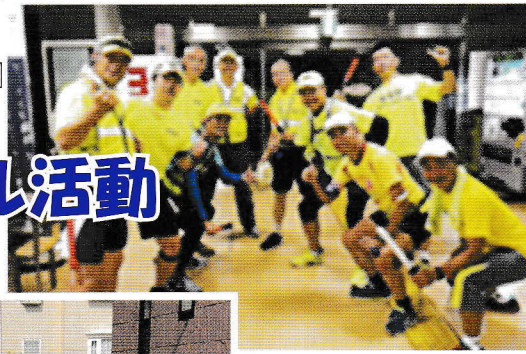
夜回りランパト Yワ (ランニングしながらのパトロール)

ご紹介しませう KFP 鵜沼はお父さん 鵜沼ふれあいトライアングル 地域の子ども