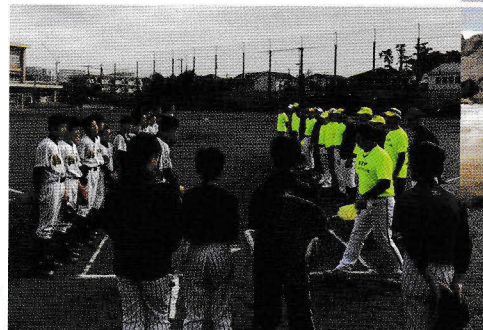
鵜沼中野球部との交流戦