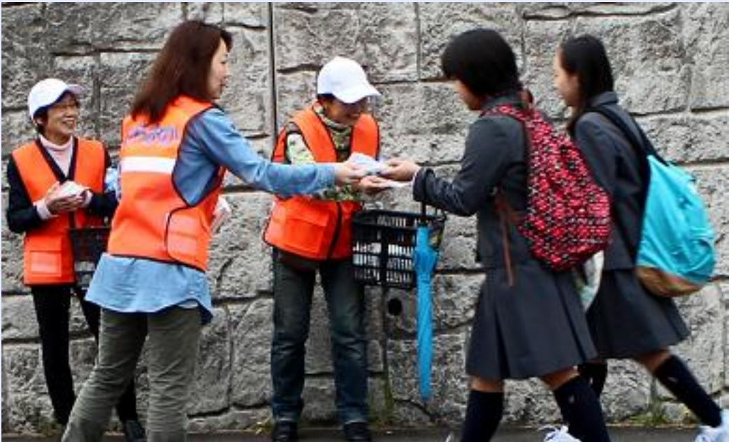
藤ヶ岡中学校でのあいさつ運動