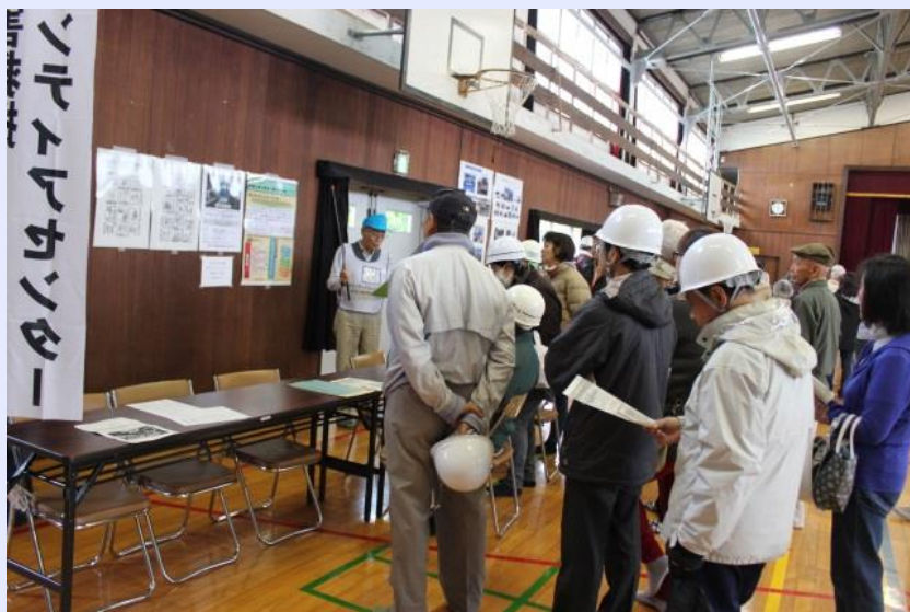
災害ボランティアサテライトセンター設置訓練