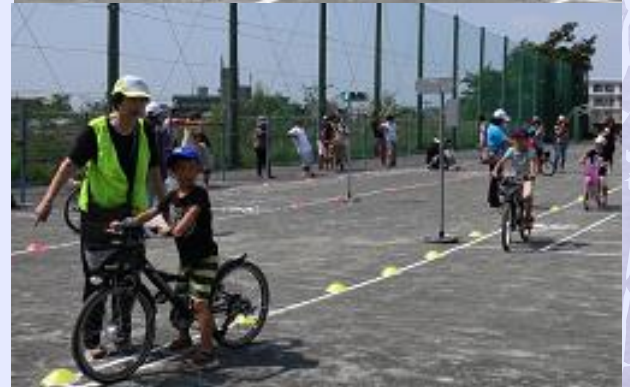
小学生対象の自転車交通安全教室