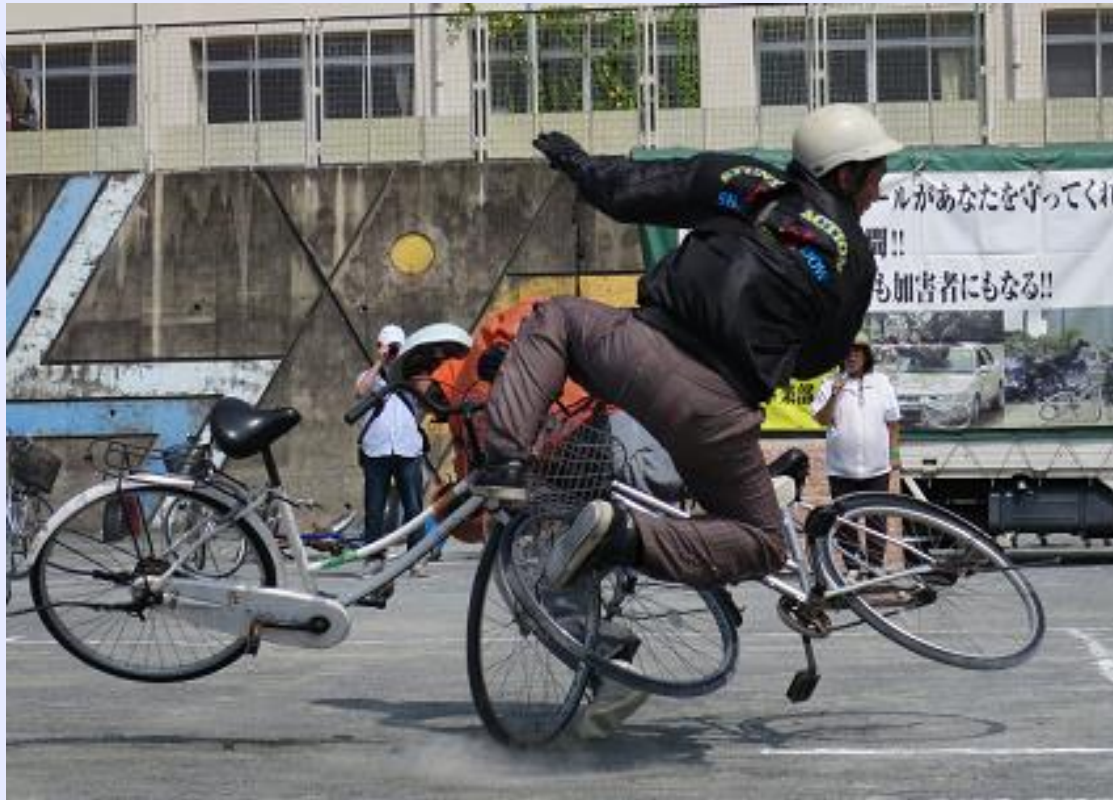
スタントマンによる交通事故再現シーン