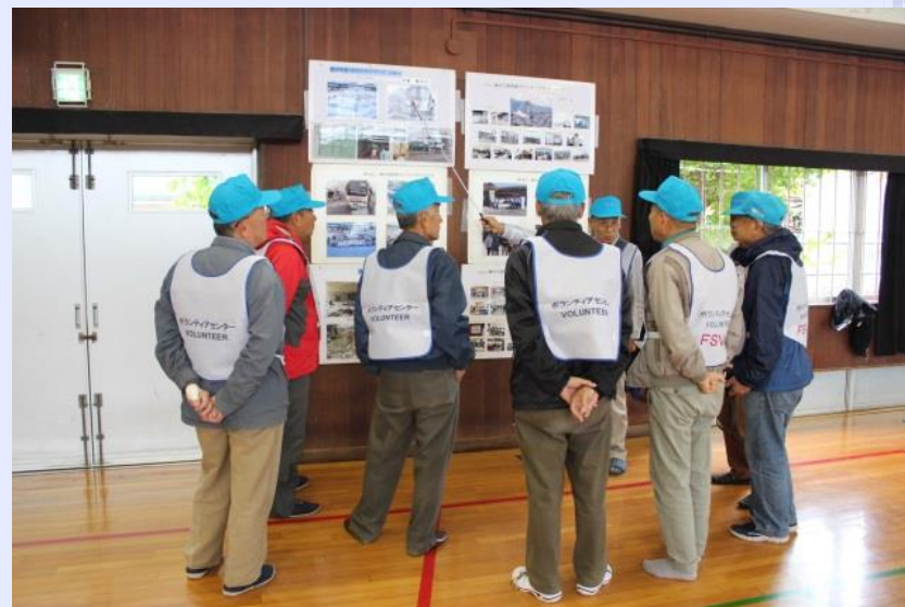
災害ボランティアコーディネーターPR活動