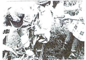
いっぱい取って、もう持てないよ～ 青柳農園にて

雨が心配されましたが、曇りでハイキング日和となりました。畑まで、距離がありましたが、頑張って歩いた後の試食は格別においしかったです。