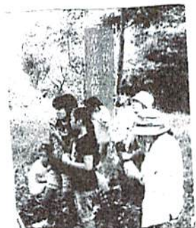
ふかしたおいも、おいしいね！ 青柳農園にて

蒸し暑い残暑の季節でしたが、ハイキング当日はとて爽やかなハイキング日和となりました。