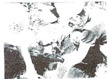
土の中から、いっぱい出てきたよ！ 青柳農園にて

気持ちの良い天気の中、遊水地に立ち寄りながら、藤沢工科高校のそばの畑までハイキングを楽しみました。