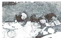
野菜切っすいとん作り