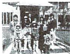
出発前にグループでポーズ