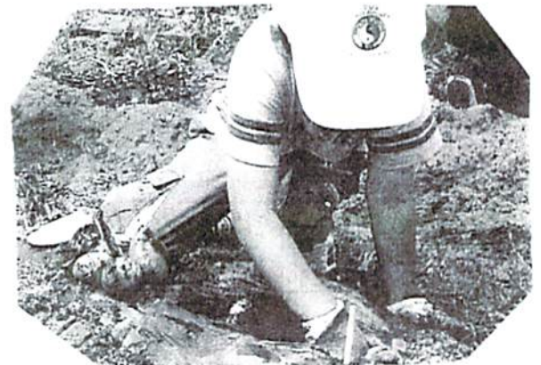
(天神町 須田勝農園にて)

前日に指導員が試食用に掘ったじゃがいもを当日の朝、民生委員の方が蒸かして現地に運んでくださり、ほっかほかのいもに 塩・ケチャップ・マヨネーズを付けて、みんなでたくさんいただきました。参加者の掘ったじゃがいもは、各自おみやげに持ち帰りました。