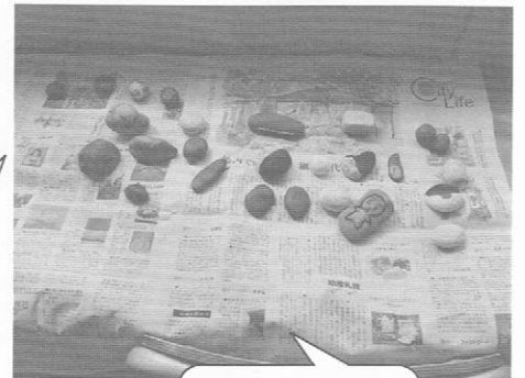
キレイな石に变身!!