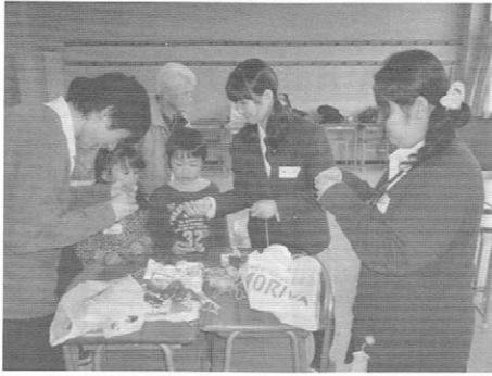
♪中学生のお姉さん ボランティアも参加!!