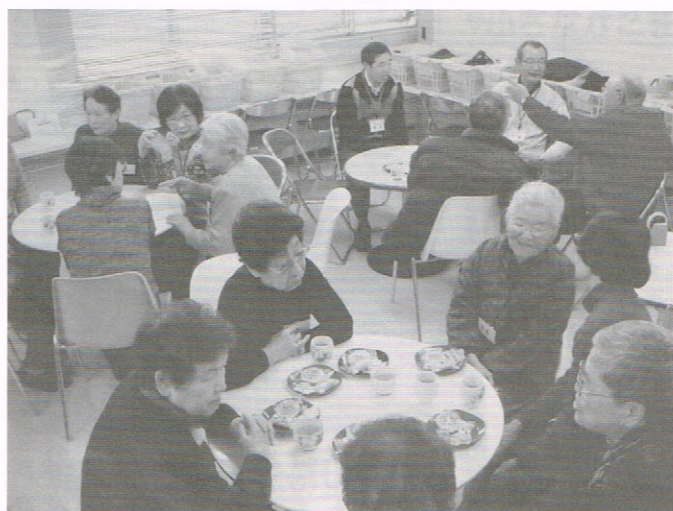
ジョワふれあいサロンの1コマ (1月28日)