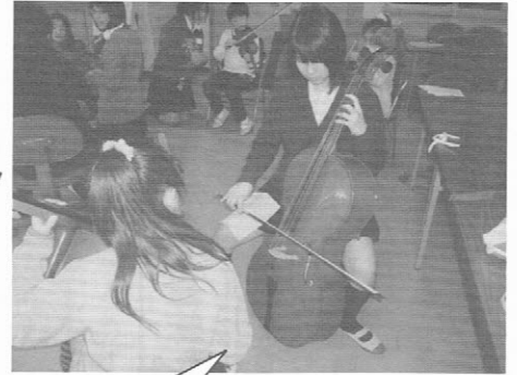
大きくなったたらチェロを習いたい! (小)