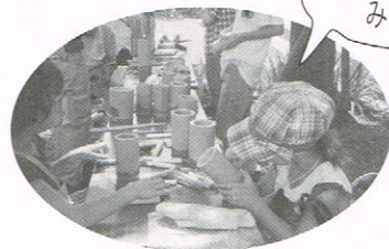
木もれ日の中、あっという間に竹のえんぴつ立てができました。