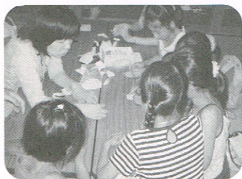
葉っぱのカサがおしゃれな折り紙のトトロ!かわいさに皆大喜び