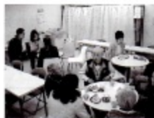
サロン風景・おしゃべり