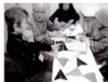
サロン風景・折り紙あそび