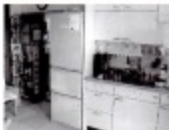
家具の移動・台所

聞き取り訪問時に十分打ち合わせを行い、当日は要望どおりの配置に納まり、大変ご満足の様子でした。