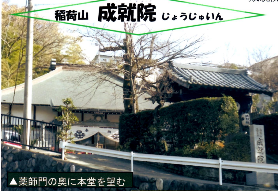
▲薬師門の奥に本堂を望む