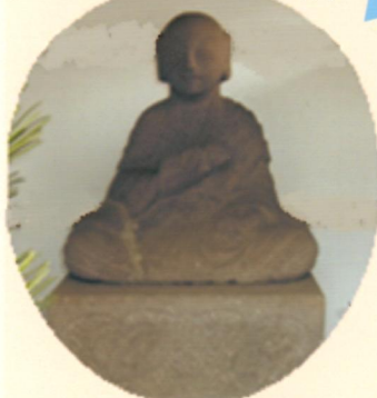
▲弘法大師座像 34 番札所、高知県【種間寺】 の土を配したとされる。