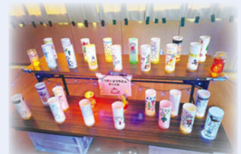
またの保育園・六会保育園 亀井野保育園・亀井野幼稚園