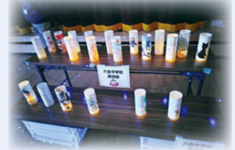
六会中学校美術部