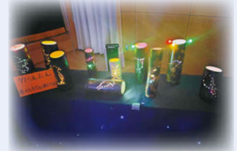
藤沢支援学校鎌倉分校