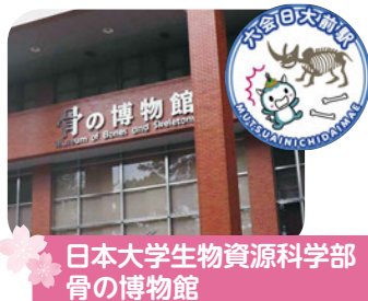
日本大学生物資源科学部 骨の博物館