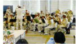
消防音楽隊の演奏