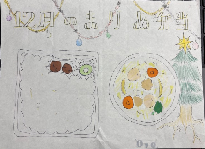
この画を見ながらお弁当を詰めます