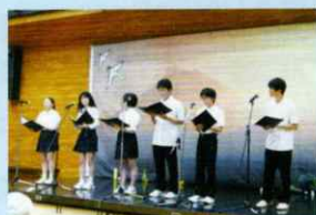
藤沢西高コーラス部