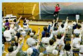
体操とゲーム指導