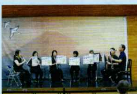
気ままにアンサンブル

当日は好天で暑さを心配しながらの実施でした。「あなたが主役！ みんなでつくろう地域の和！」を合言葉に、出演4団体の楽しいパフォーマンスと、素敵な演奏、美しいコーラスで大盛り上がり！参加者からは「来年も楽しみにしています」「ありがとう、楽しかったです」等の声をいただきました。