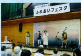
軽音楽 いっきーず