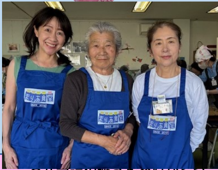
お弁当詰め班さんありがとう