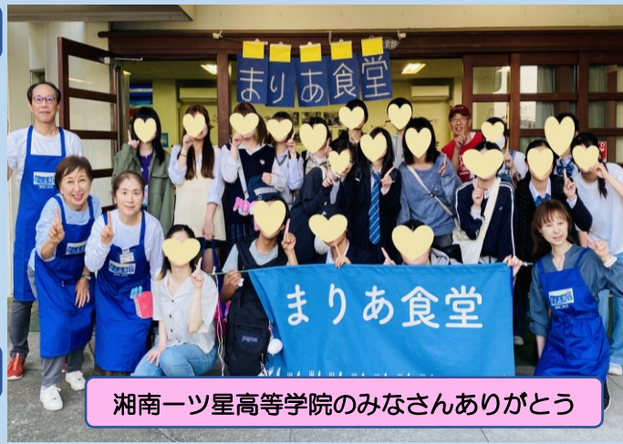
湘南一ツ星高等学院のみなさんありがとう