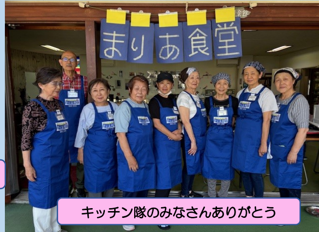
キッチン隊のみなさんありがとう