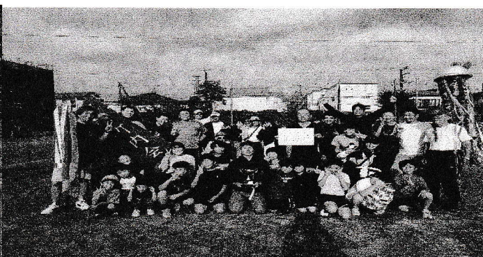
レクリエーション大会優勝 苅田町内会