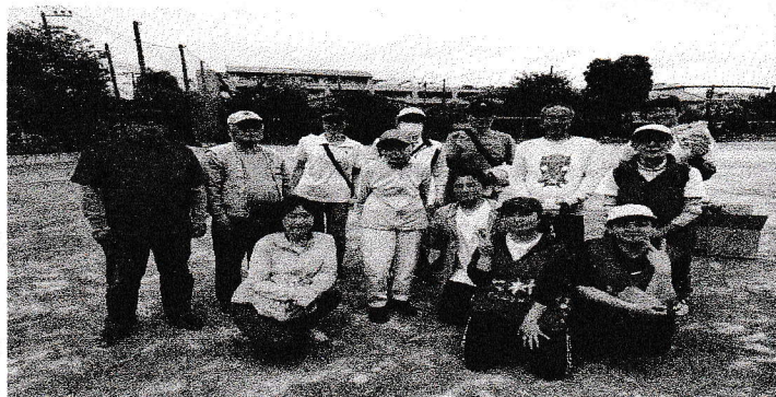
グランドゴルフ大会優勝 上村町内会