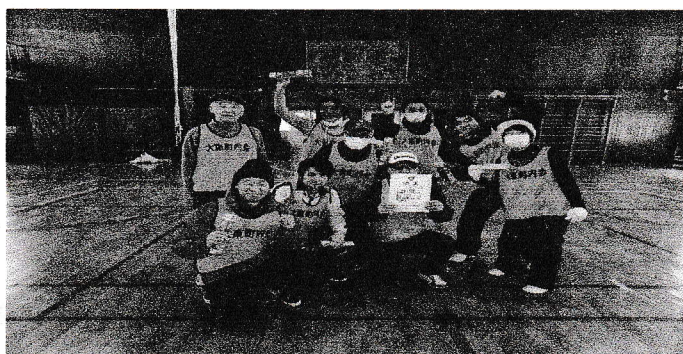
カローリング大会優勝 大東町内会