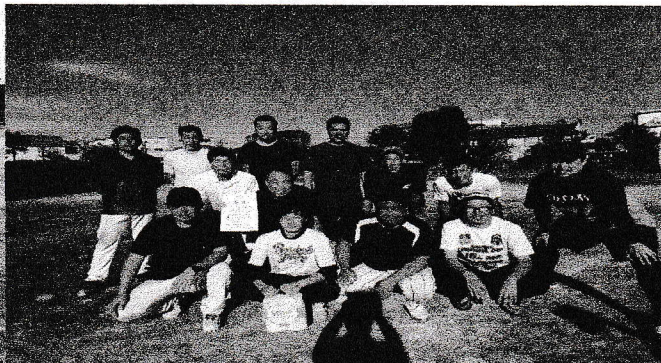
ソフトボール大会優勝 苅田町内会