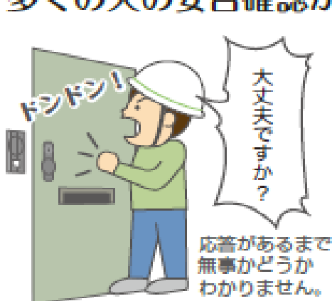
タオルがない場合