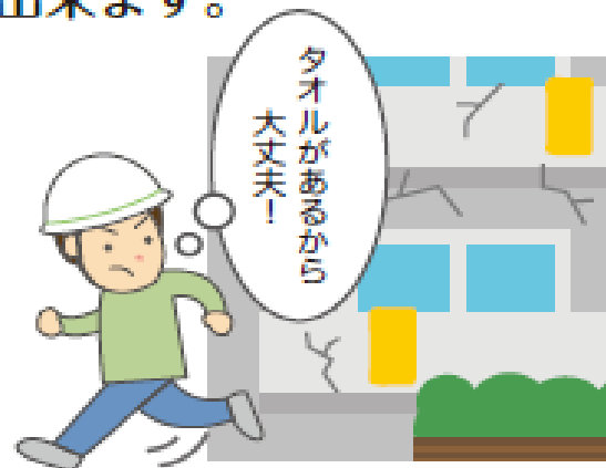
タオルがある場合