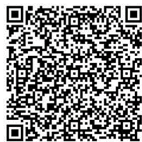
申込み二次元コード