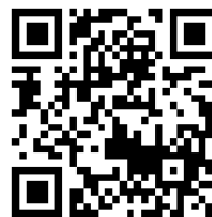
村岡地区ポータルサイト