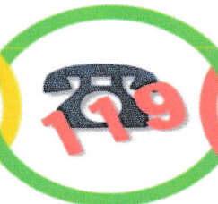
早期 119 番 通報