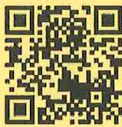
村岡地区ポータルサイト