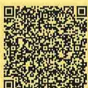
申込み二次元コード