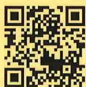
村岡地区ポータルサイト