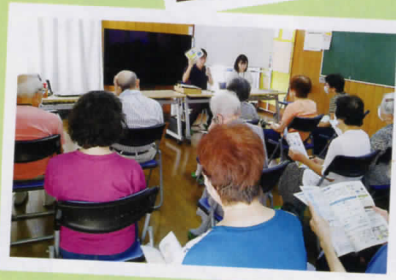
9月4日(水) 緊急通報システム説明会 高齢者支援課協力