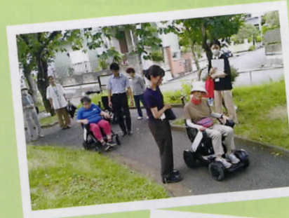
7月9日(火) 電動歩行アシスト試乗会 デジタル推進室協力