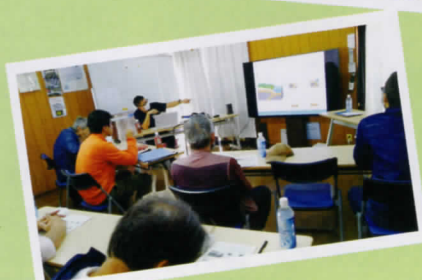
10月12日(土) 防災隊講演会 危機管理課協力