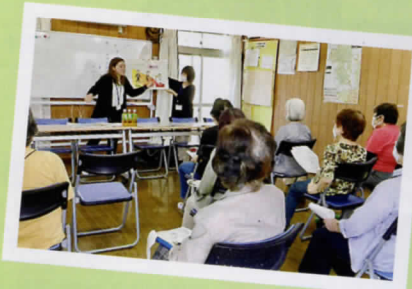
5月30日(木) シニアいきいき 「フレイル予防」講座 健康づくり課協力

現在、役員会は隔月に実施し、出来ることをしてきましたが、下記のようなイベントができました。