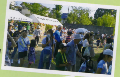
7月21日(日) 夏まつり B茅ヶ崎自治会と共催