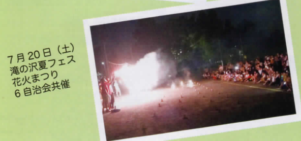
7月20日(土) 滝の沢夏フェス 花火まつり 6自治会共催