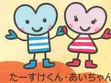
たーすけくん・あいちゃん

開設されてしばらく経ち、だんだんと居心地の良い居場所になってきていると感じています。もっと「こころま」のことが広まって、いろんな方が来てくれるといいなと思っています。