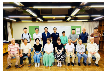
令和6年度 自治連役員