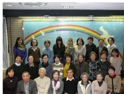
【片瀬地区民生委員児童委員】 お気軽にご相談ください！

民生委員児童委員は、いつ でも私たちのそばに寄り添い、 あたたか見守ってくれてい るのですね。