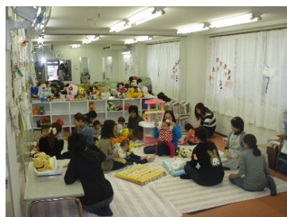
【かたせ・にここ広場】 第1週を除く木曜日10時～15時