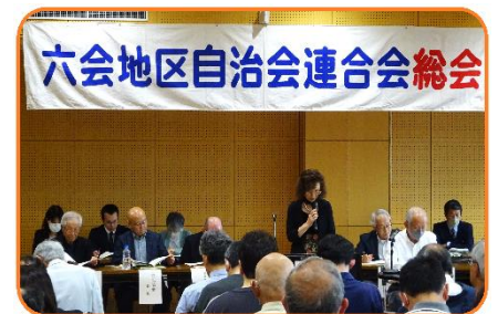
《事業及び予算計画案の公表》