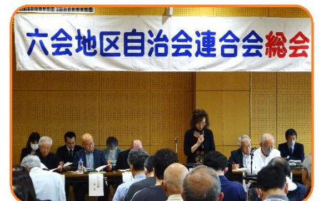
《事業及び予算計画案の公表》