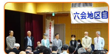
《自治会連合会の今年度役員紹介》