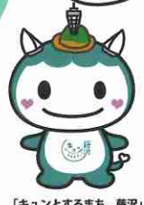
「キュンとするまち。藤沢」 公式マスコットキャラクター ふじキュン♡