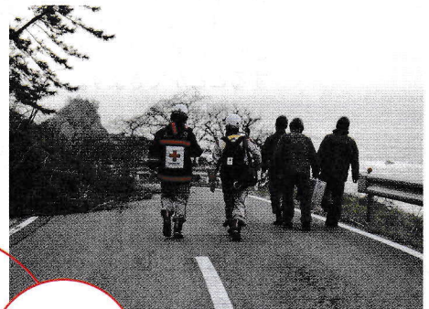
▲寸断された道路を自衛隊員と進む同救護班(石川県珠洲市)