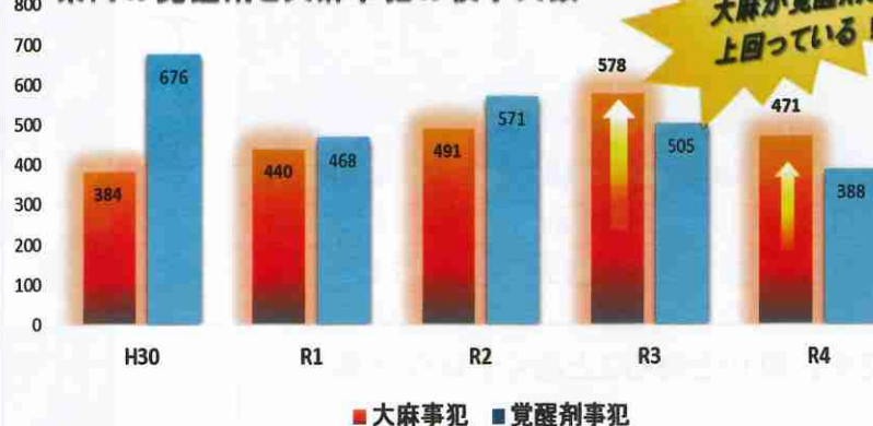
県内の覚醒剤と大麻事犯の検挙人数