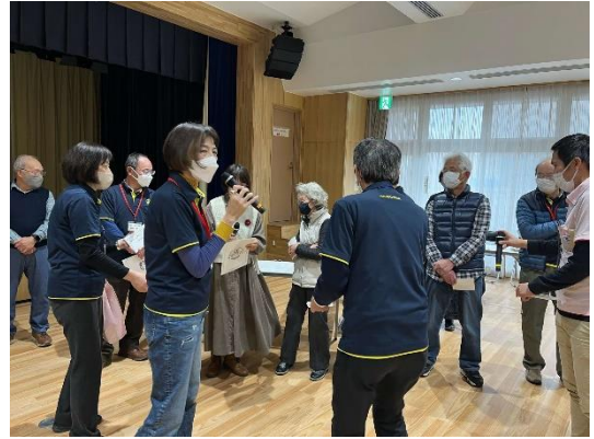
シン辻堂カルタの体験②