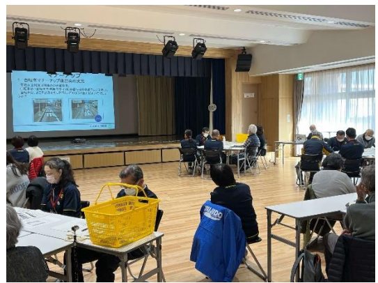
【第1部】辻堂まちづくり会議の取組とこれから