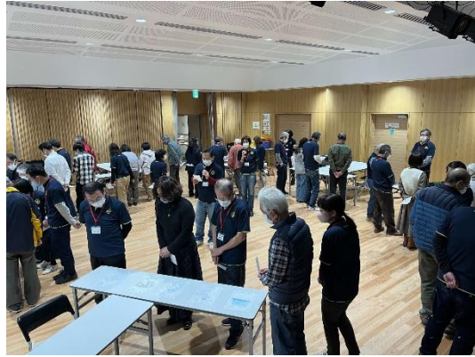
シン辻堂カルタの体験①