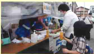
村岡ふれあいまつりに 出店して

令和4年度第47回 村岡ふれあいまつりに 令和4年11月13日(日) 終日5名の社協委員が販売員として飲料物(ペットボトル)を販売し240本を売り上げ、まつりの賑わいに多いに花を添えました。