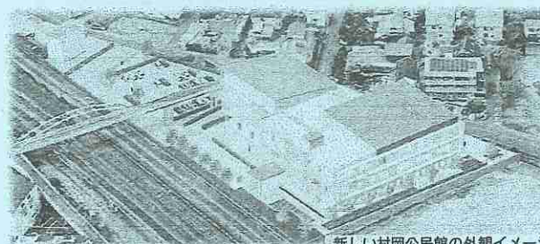
新しい村岡公民館の外観イメージ

皆様にも随時情報をご提供してまいりますので、引き続き、ご理解ご協力いただきますようお願いいたします。