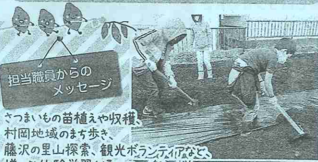
担当職員からのメッセージ さつまいもの苗植えや収穫、村岡地域のまち歩き、藤沢の里山探索、観光ボランティアなど、様々な体験学習を通して、楽しく学び、仲間づくりをしませんか?親子で体験するプログラムもあります。

メールアドレス: fj-mura-k@city.fujisawa.lg.jp 件名に「きらりっこ申し込み OO OO(申し込み方のお名前)」 本文に ①氏名(ふりがな) ②住所 ③電話番号 ④学校名 ⑤学年 を記載して送信してください。