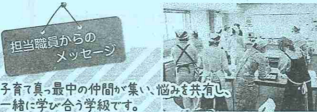
担当職員からのメッセージ

★申込受付時間:平日の午前8時30分から午後5時まで受付 ※抽選の結果は申し込みされた方全員に通知します。