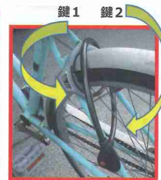
鍵1 鍵2 自転車盗被害時の施錠の有無

自転車盗が急増しています。複数の鍵（ダブルロック）で盗まれないようにしましょう。