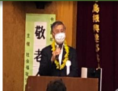
鈴木恒夫藤沢市長 お祝いのお言葉