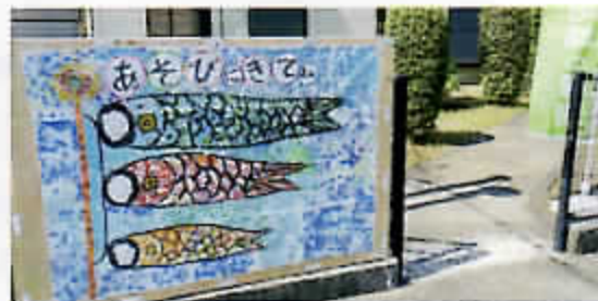
5月 こいのぼり貼り絵展示

湘南大庭地区の子どもたちが、放課後、安心して自由に過ごせる場を提供し、子どもと子ども、子どもと大人、大人と大人が交流できる居場所づくりを目指しています。