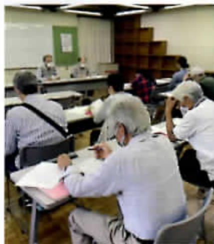
ジョワ全体会の様子

引き続き昨年の活動報告や、新年度活動方針等4件の議題が審議・承認され、コロナ禍で3年ぶりの開催となった全体会を終了しました。