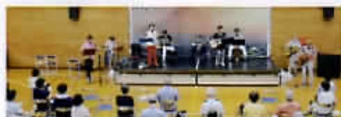
フォークフレンズ

急に暑さが増した日でしたが、座席間の距離を十分に空け、コロナ感染予防を徹底し、定員80名満員で開催できました。会場の皆さんが手拍子や体でリズムを取り、出演者と一つになって大いに盛り上がりました。特に知的障がい者自立支援施設 Music of Mindの方々の一生懸命な音楽には、会場全体が感動で満ちあふれました。