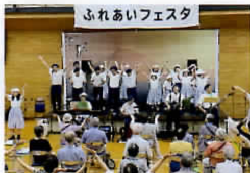
Music of Mind