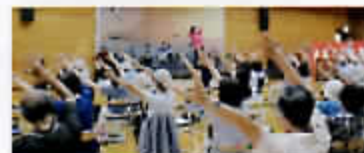
楽しく体を動かしましょう