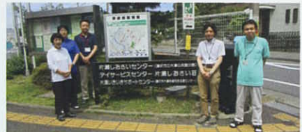
片瀬いきいきサポートセンター