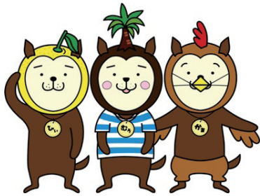
宮崎県シンボルキャラクター「みやざき犬」

気象情報や避難勧告・指示の発令状況などの防災情報と、防犯情報などをメールでお知らせするサービスです。配信を希望する地域（市町村）と情報の種類（地震や台風など）を自由に選ぶことができます。