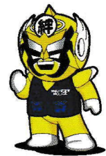
特殊詐欺撲滅ヒーロー 絆大使振り込まセンジャー