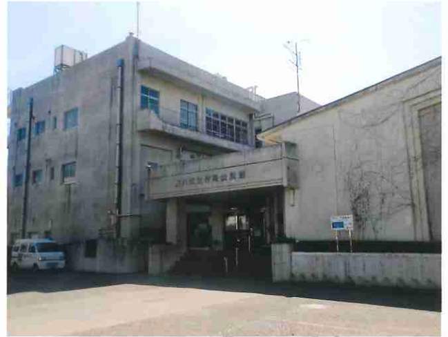
《現在の村岡公民館》

今回は、これまでの再整備事業の経緯と、本年1・2月に開催した第12回・第13回建設検討委員会の結果についてお知らせします。