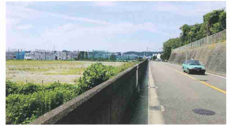
《移転予定地（村岡東1-5-8の一部他）》