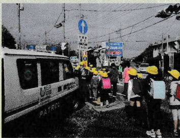
神奈川県内では、457団体、1,583台の青パト車両が活躍中です（令和2年末現在）