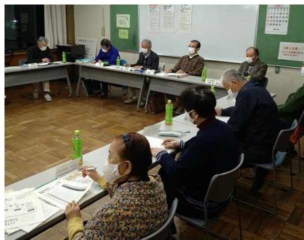
中央：市社協／CSW 右側：いきいきサポートセンター 左側：地域包括ケアシステム推進室